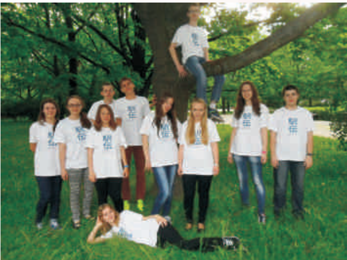
Wolontariusze z VII LO im. J. Słowackiego w Warszawie - zdjęcia wykonane po biegu - Accreo Ekiden