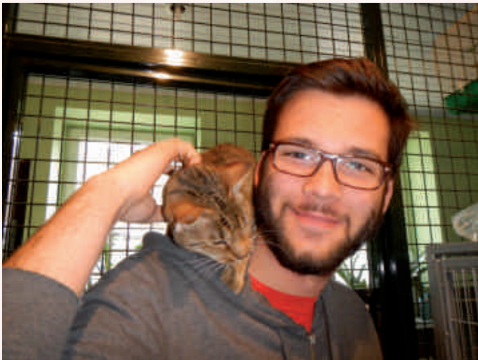
ZS nr 7 w Warszawie, wolontariusz pomaga w schronisku