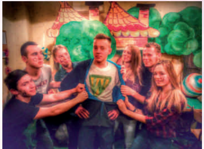
SUPERWOLONTARIUSZ - Grupa Zielony Parasol z Bydgoszczy