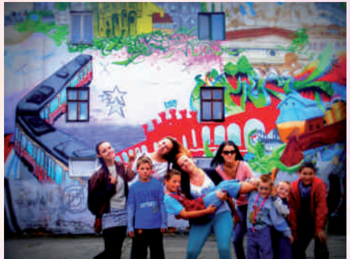
Wolontariusze Agrafki z Pabianic z dziećmi podczas półkolonii - Pamiętniki z Wakacji, sierpień 2013