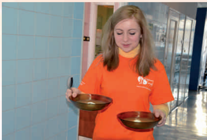
Wolontariuszka Centrum Wolontariatu w Gorlicach pomaga w Szpitalu Specjalistycznym im. H. Klimontowicza w Gorlicach