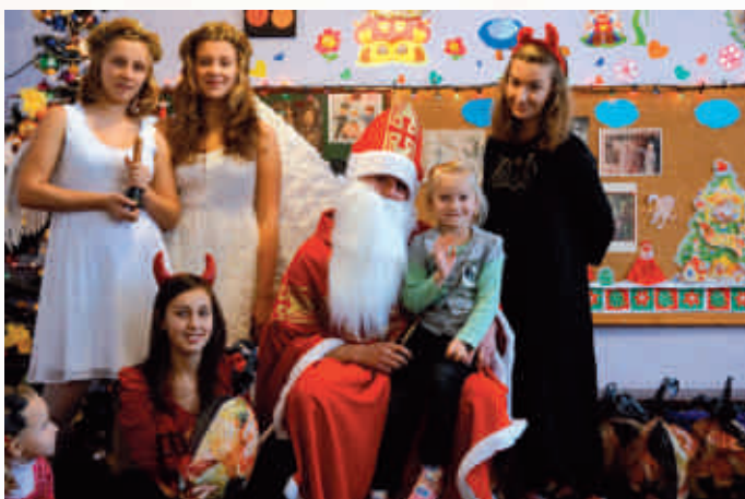
Klub wolontariusza w Gryfowie Śląskim - Odwiedziny Świętego Mikołaja w przedszkolu

Odpowiadając na nasz apel o zbudowanie największej wystawy prezentującej młodej polskiej młodzieżowych wolontariuszy z całej Polski przesyłały nam zdjęcia ukazujące swoje działania. Różnorodność fotografii, które w łamach drugiego numeru Gazety „Fabryka Dobra” pokazuje jak barwny i ciekawy jest wolontariat. Mamy nadzieję, że tych zdjęć pozwoli Państwu docenić ogrom pracy jaką wykonują ci młodzi ludzie.