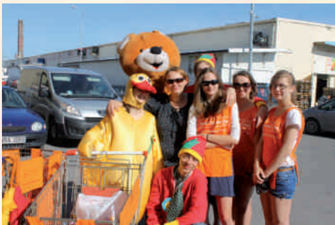
Szkolne Koło Wolontariatu IV LO Radom na corocznym festynie -Dziękujemy Darczyńcom