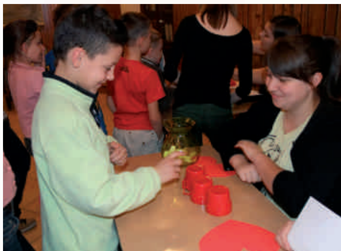
Wolontariat I Lo w Olkuszu - Andrzejki z dziećmi