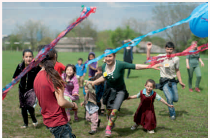
Grupa CzujCzuj - wolontariat zagraniczny, Soroca, Moldova