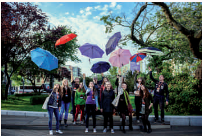
Wolontariusze Muzeum Emigracji w Gdyni