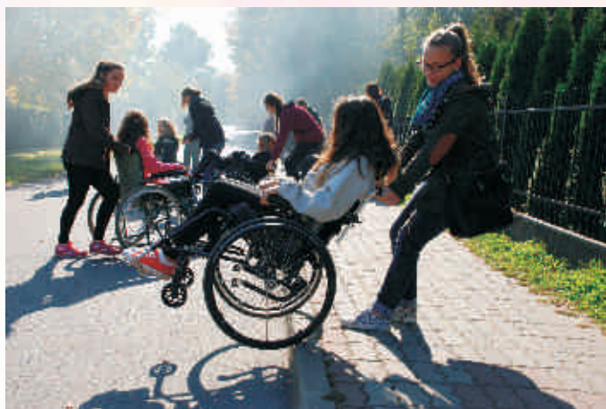
SKO z ZS w Nowej Sarzynie szkolenie z asekuracji i pomocy osobom na wózkach