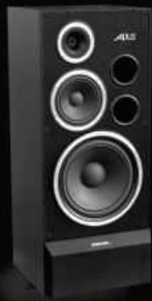
Legendarny ALTUS 200